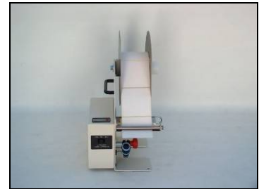
LD-100-RS with Counter and Flanges